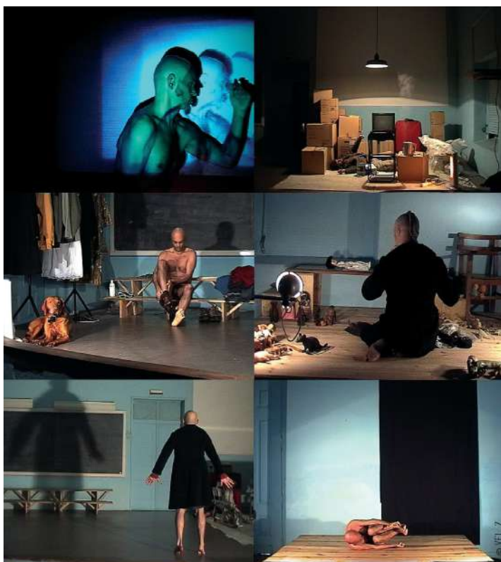
7. Compilação de Imagens. Autoria VEL Z